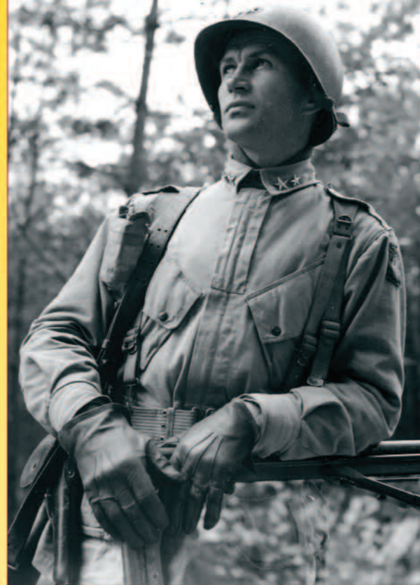
James Gavin

Dieser plötzliche Erfolg ließ den Kommandeur der 28., General Norman „Dutch“ Cota, seine übrigen Verluste vergessen, und er fühlte sich „ein bisschen wie Napoleon“.