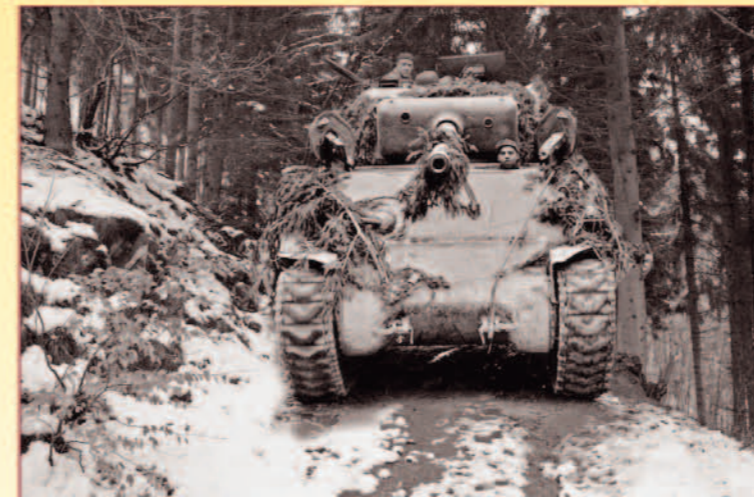
Sherman-Panzer auf dem Kall Trail - Fotomontage: Konejung

dass mit diesen abgekämpften Soldaten keine Schlacht mehr zu gewinnen war. Die 28. wurde daraufhin zur Auffrischung in eine vermeintliche Ruhestellung verlegt, an der nach Meinung der alliierten Führung kein deutscher Angriff möglich sei: in die Ardennen. Nur wenige Wochen später wurde sie dort bei der deutschen Gegenoffensive fast völlig zerschlagen.