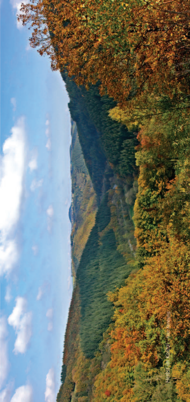
Herbst im Kalltal

wundung zu immer mehr – von der Führung euphemistisch bezeichneten – „nicht kampfbedingten Ausfällen“, womit Grabenfuß, Erfrierungen und Lungenentzündungen gemeint waren. Gibt die Erste US-Armee für den Zeitraum von 1. September bis zum 15. Dezember 1944 die Zahl von 47.039 Toten, Vermissten und Verwundeten an, so kamen noch einmal 50.867 Ausfälle durch Krankheiten und physische wie psychische Erschöpfung dazu.