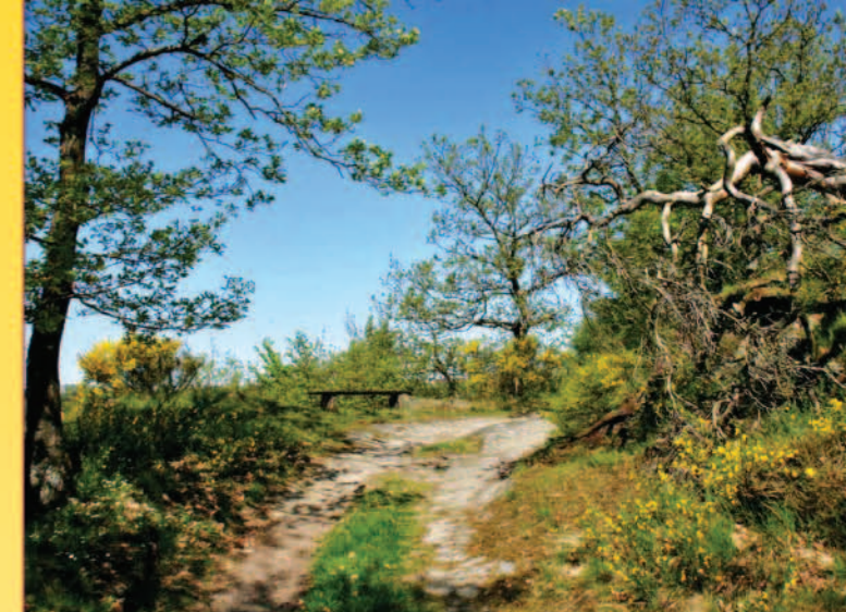
Panzerspuren an der „Dekke-Ley“